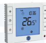
Электронный термостат GT2016DA/DB для 2-х трубных фанкойлов GT2016D4 для 4-х трубных фанкойлов.