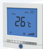
Электронный термостат GT2023DA/DB для 2-х трубных фанкойлов GT2023D4 для 4-х трубных фанкойлов.