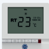
Электронный термостат GT108DA для 2-х трубных фанкойлов GT108D4 для 4-х трубных фанкойлов