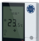
Электронный термостат GT2010DA/DB для 2-х трубных фанкойлов GT2010D4 для 4-х трубных фанкойлов.